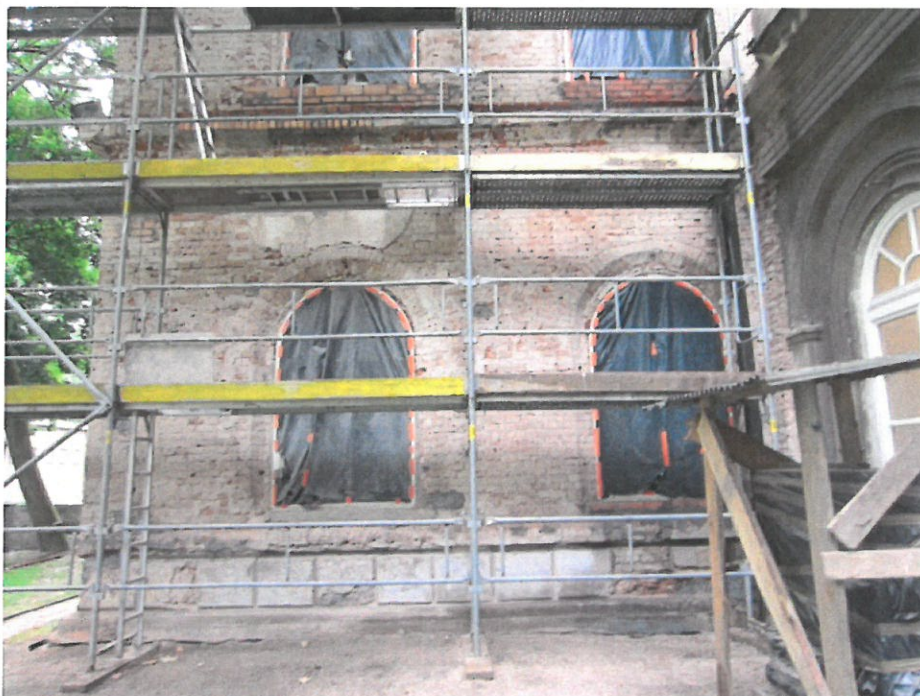
Fot.5. Fragment cokołu kamiennego na narożu ryzalitu na ścianie północnej budynku, po usunięciu cementowych nawarstwień i wtórnych uzupełnień.